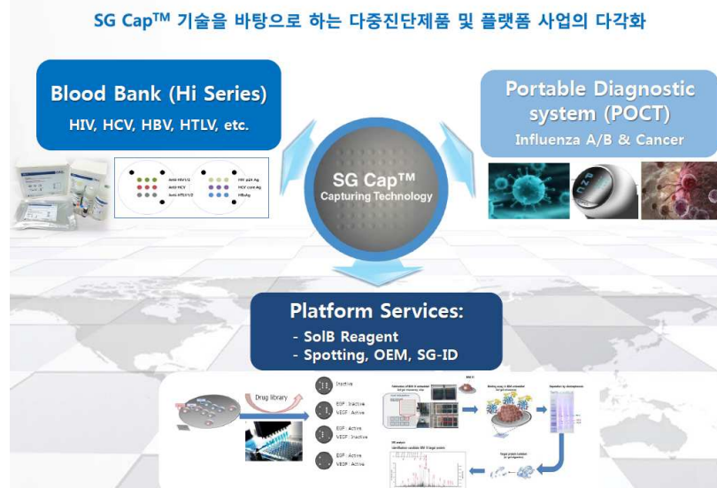
[그림 1] 피씨엘 주요사업